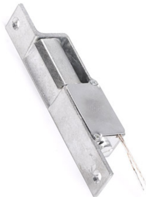
Wymiary i zdjęcie zaczeu