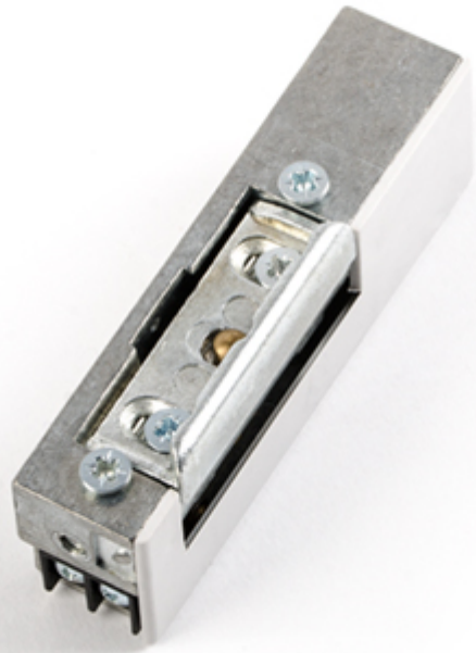
Wymiary i zdjęcie zaczeu