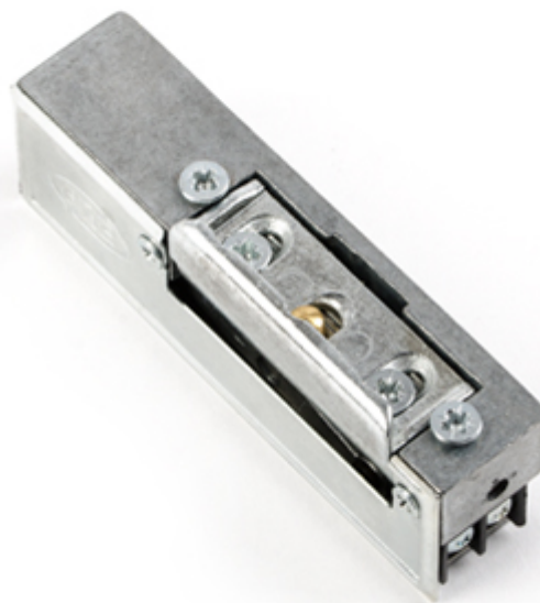
Wymiary i zdjęcie zaczeu